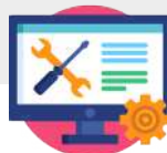
Organisme de formation